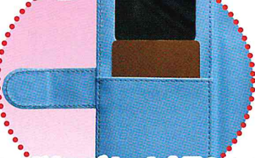
カードをマグネット金具のあるスマートフォンケースに入れる