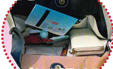
マグネット金具のあるバッグのポケットに入れる