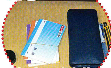
引き出しに通帳等を束ねて保管する