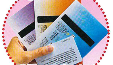
磁気テープ同士が触れ合う