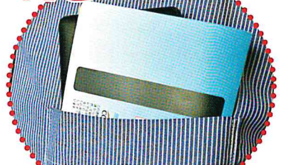
スマートフォンと胸ポケットに入れる