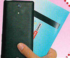
スマートフォンと通帳を重ねて持つ