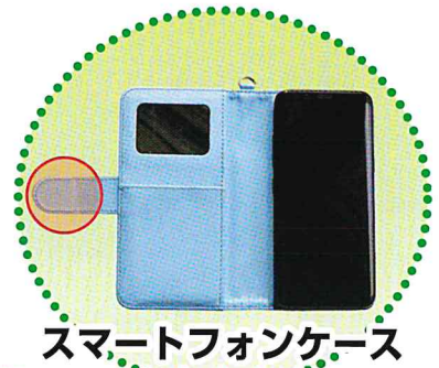
スマートフォンケース